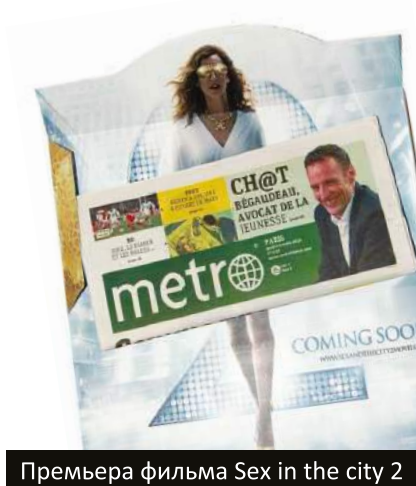
Премьера фильма Sex in the city 2