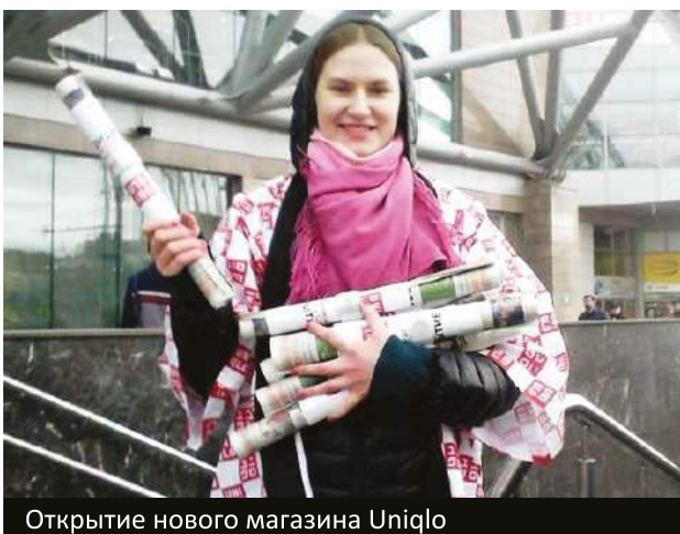
Открытие нового магазина Uniqlo