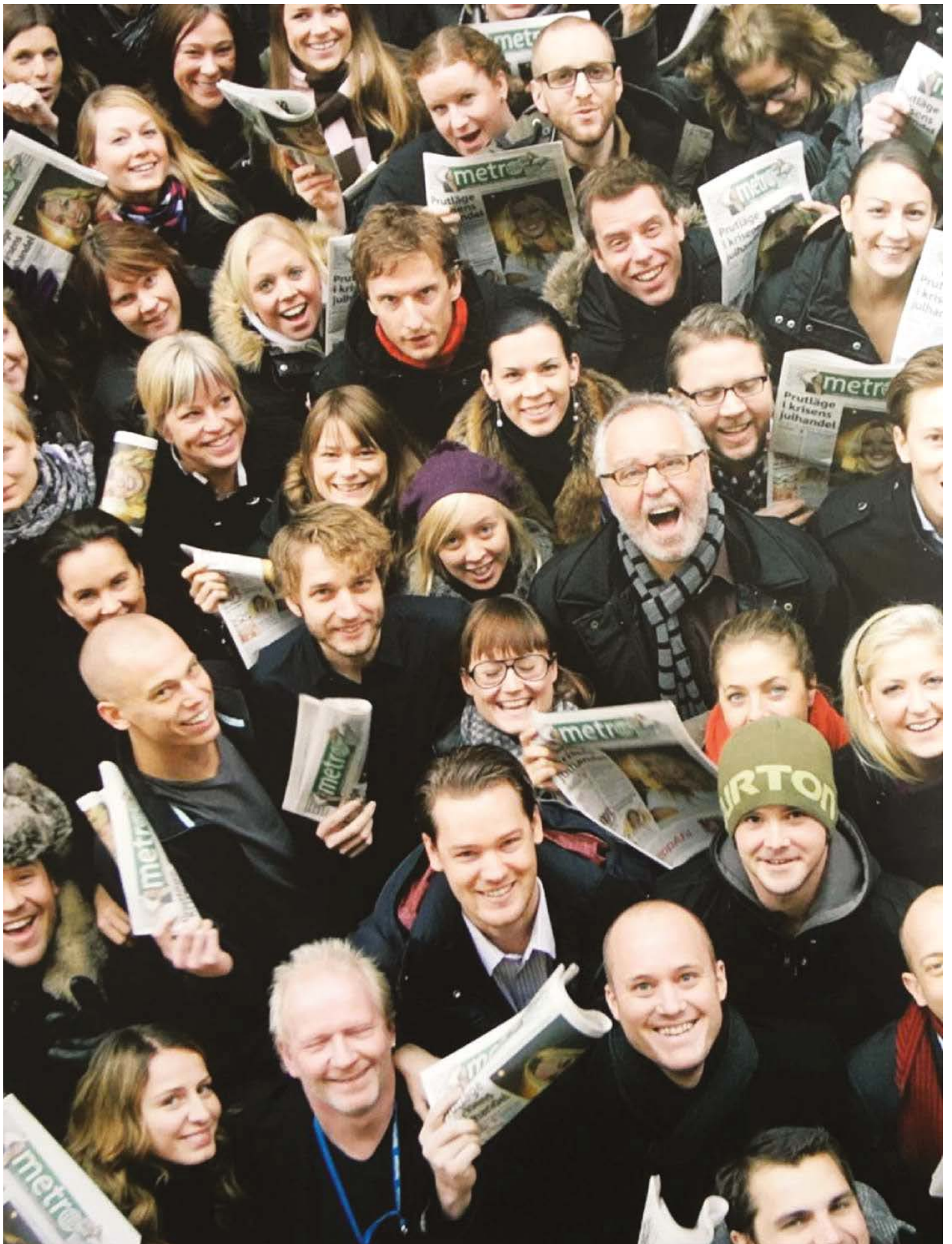
Редакция "Метро Стокгольм" с первым выпуском газеты, февраль 1995 года